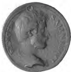
LAUREZZINO DES MEDICIS.